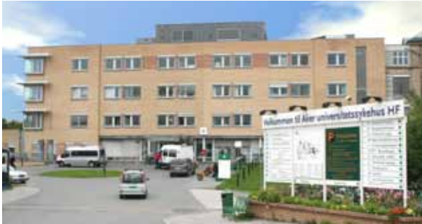
Sykehus: Butikk eller velferdstjeneste?