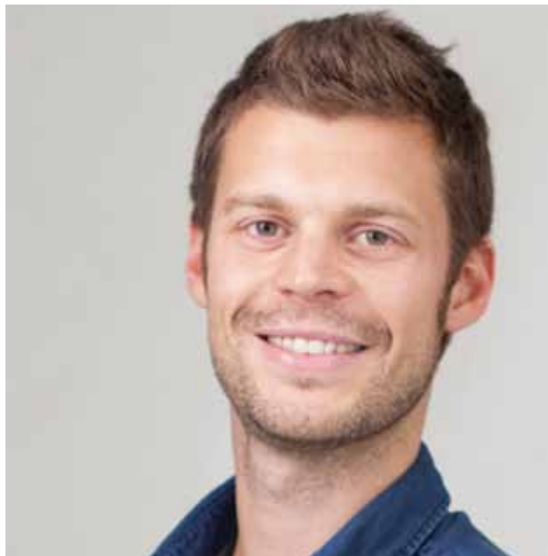
Rødt-kandidat: Bjørnar Moxnes.

– I Oslo har Høyre/Frp-byrådet gjennom åtte år vist at de ikke løfter en finger for å revaske renholdsbransjen. I slutten av juni kom en rapport