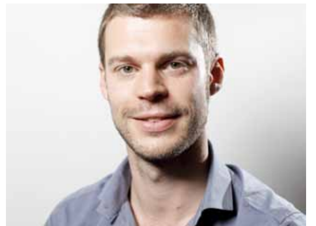
Tamilvenn: Bjørnar Moxnes.

– Er det én lærdom vi kan hente fra kampen mot apartheid i Sør-Afrika, så er det at vi ikke får forsoning uten rettferdighet. Først når de skyldige stilles for retten og får sin dom, legges grunnlaget for fred og forsoning. Derfor er det så viktig at det internasjonale samfunnet gransker anklagene mot Sri Lankas regjering om krigsforbrytelser og