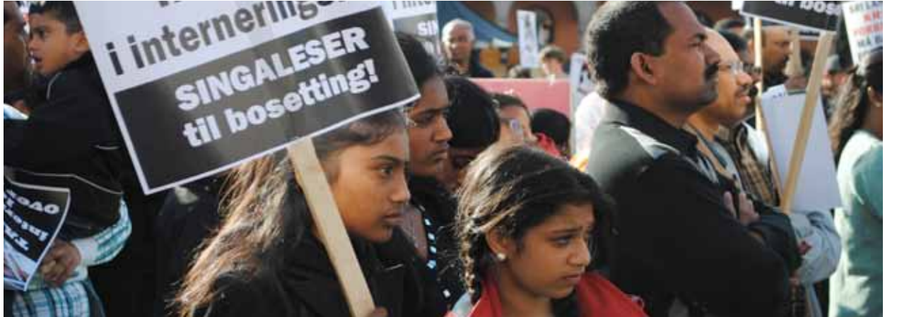
Trenger støtte: Norske tamiler demonstrerer i Oslo.