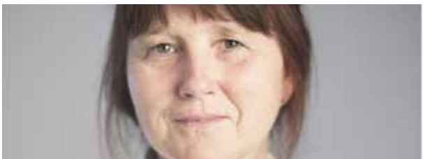
Rødt-leder: Turid Thomassen.